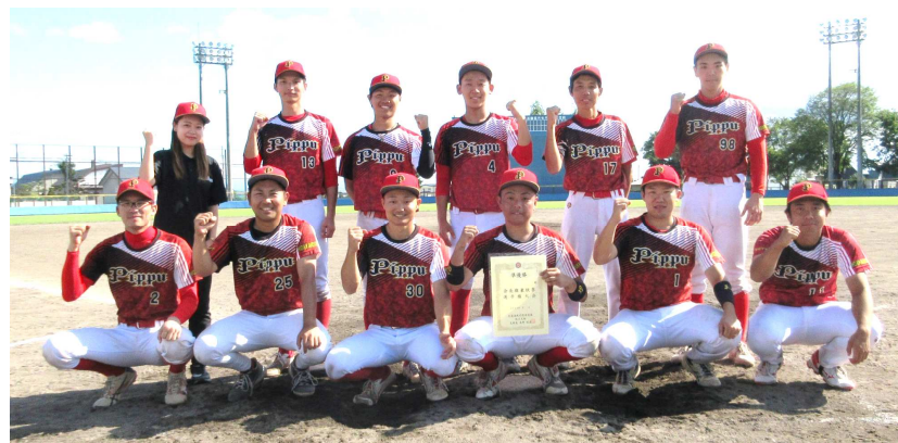
第二代表: 比布町役場

両チームは10月5日ドリーム球場で行われます「第48回新日本スポーツ連盟主催全国選抜北海道大会」に第1・第2代表として出場します。全国(静岡県草薙球場)目指して頑張ってください