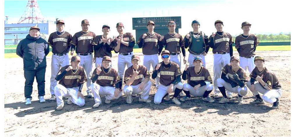
優勝 旭川市消防署野球部

優勝おめでとうございます。 優勝いたしました旭川市消防署野球部は下記 大会に出場いたします。 第76回 全官庁第大会3ブロック大会 2025/7/5・6 ドリームスタジアム 全官庁へむけて頑張ってください。