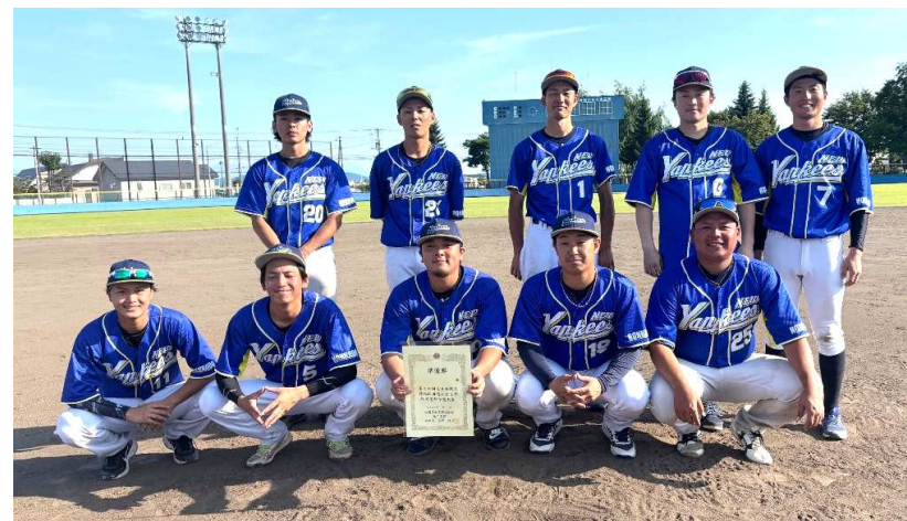
準優勝 : ニューヤンキース