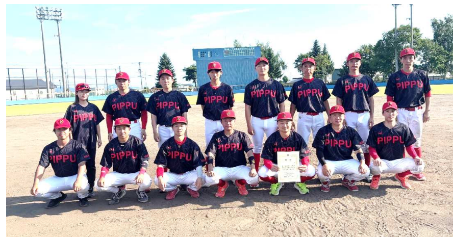
優勝 : 比布町役場